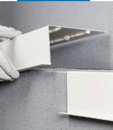
Collage élastique d'éléments de construction