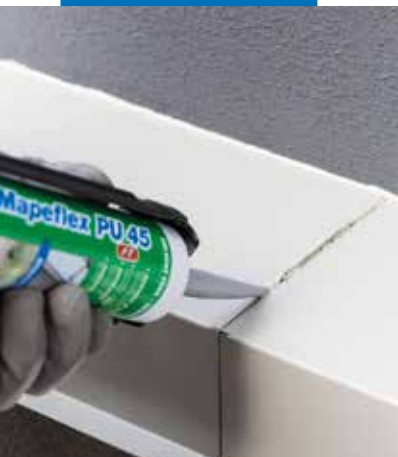
Jointoiment élastique de joints de construction

Mapeflex PU 45 FT polymérise rapidement avec l'humidité de l'air. Ses caractéristiques offrent des garanties de durabilité et permettent son utilisation aussi bien sur les surfaces horizontales que verticales. Le produit est prêt à l'emploi et disponible en cartouches métalliques et en boudins aluminium rendant l'application pratique et facile au moyen d'un pistolet à extruder. Sa consistance permet une mise en œuvre rapide et, grâce à sa rapidité de durcissement, une mise en service dans des délais très courts avec les avantages économiques qui en découlent.