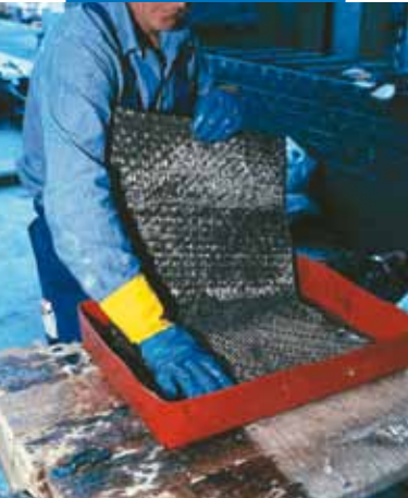
Impregnation manuelle de Mapewrap C