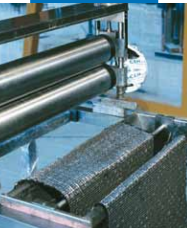
Impregnation à la machine de MapeWrap C